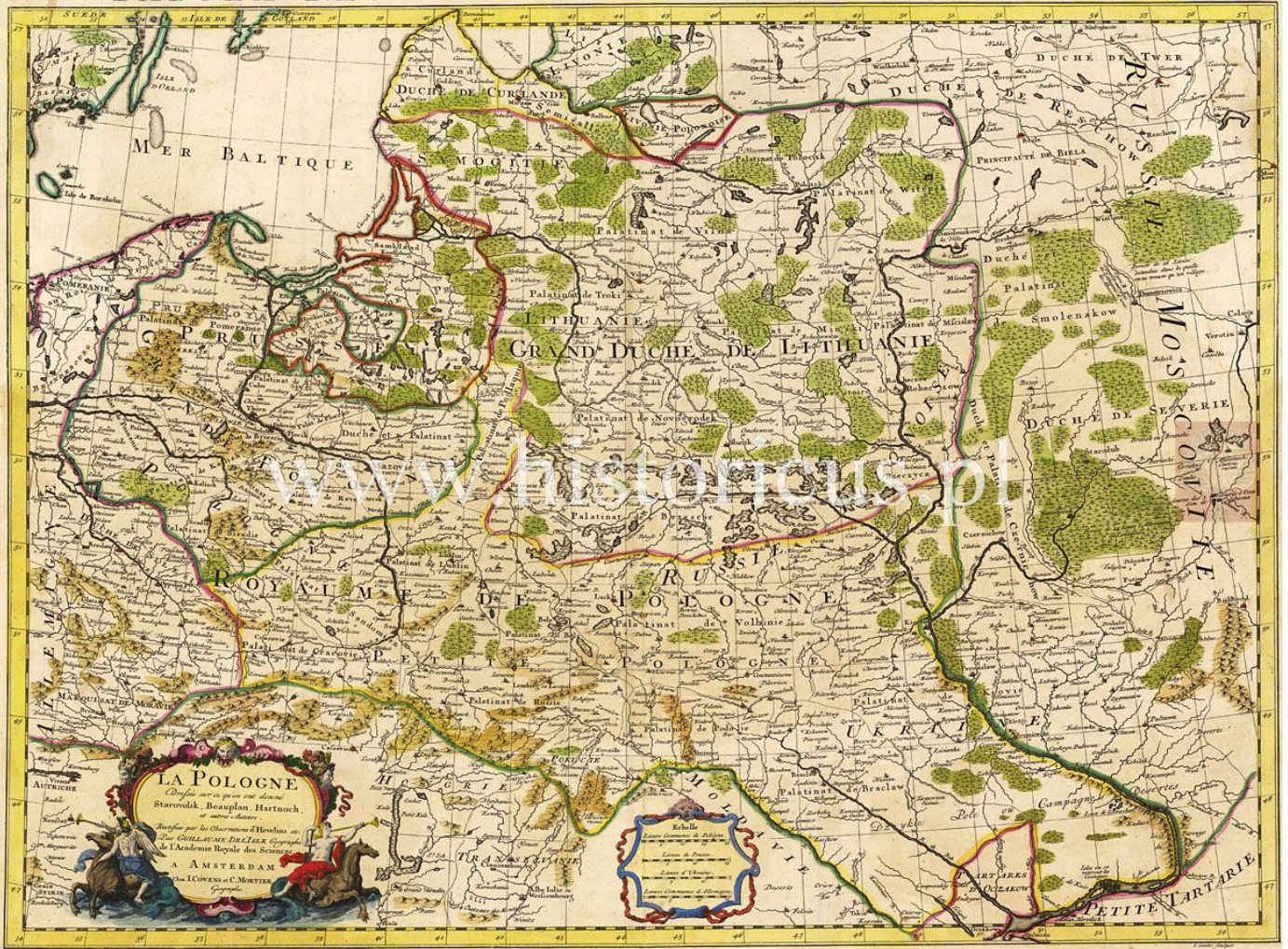
La Pologne Dressée sur ce qui en a esté Starovolsk, Beauplan, Hartnack et autres Auteurs. Map of Poland, made by Guillaume Delisle Scale about 1:2 600 000, published in Amsterdam by J. Covens et C. Mortier in 1736.